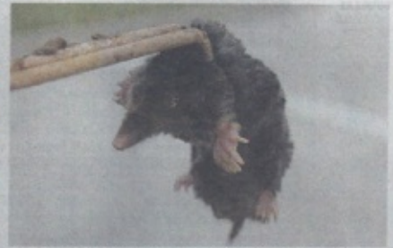
Une taupe d'Europe prise à la pince à ressort. C'est le piège le plus efficace et il provoque une mort instantanée.