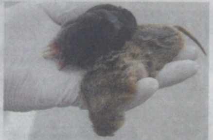
Une taupe et un campagnol terrestre piégés par Adrien Dubois.