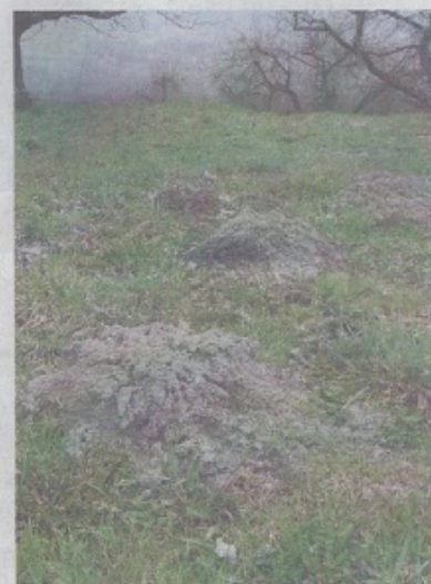
Taupinières, la hantise des agriculteurs. Et des propriétaires de pelouses...